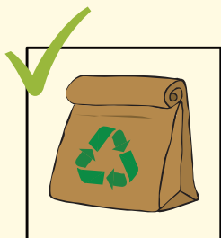
Sacchetti di carta